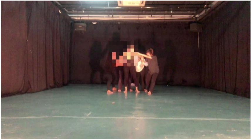
Rajah 4: Babak Interaksi Bersama Wanita (buli)

Mak Nyah, akan tetapi penari Mak Nyah menggunakan badan beliau sendiri untuk menghasilkan pergerakan. Akan tetapi kekurangan ini menjadi satu kelebihan kerana badan penari Mak Nyah itu menghasilkan pergerakan yang berbeza tetapi asli dan bermakna.