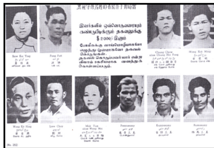
மூலம்: Pamphlet No. 252: Reward for Batu Arang Gang, dalam Fail Jabatan penerangan Malaysia 1949, 990/49/252

சிலாங்கூரில் இந்திய மற்றும் சீன கம்யூனிச பயங்கரவாதிகள்.