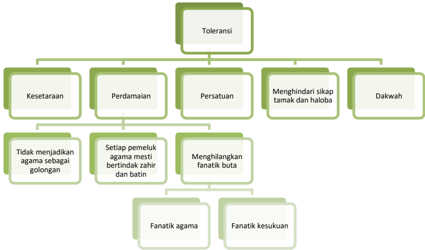
Jadual: 6: Maqasid al-Quran Model Kontemporari HAMKA