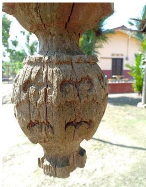
Gambar 1: Salah satu reka bentuk buah buton yang terdapat di Luak Tanah Mengandung, Negeri Sembilan