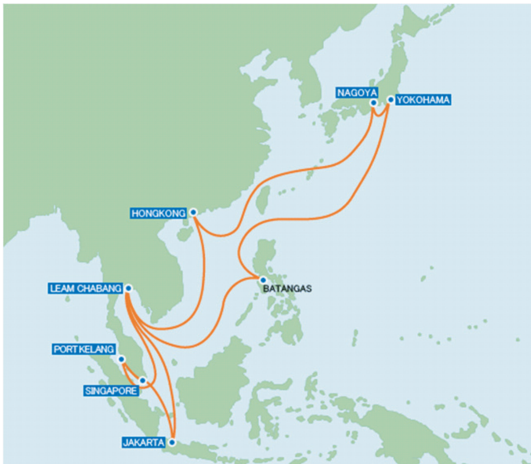
Peta 1.0: Lokasi Pelabuhan-pelabuhan Utama di Asia Tenggara

Namun, sejak abad ke 20 sebahagian besar daripada pelabuhan-pelabuhan utama di dunia mula bertumpu di rantau Asia iaitu di Asia Tenggara dan Asia Timur. Dalam tahun 2009, 15 daripada 20 buah pelabuhan kontena utama dunia terletak di Asia manakala hanya lima buah pelabuhan sahaja terletak di barat. 2 Antara 15 buah pelabuhan tersebut termasuklah Pelabuhan Singapura yang merupakan pelabuhan kontena utama dunia, Pelabuhan Hong Kong, Pelabuhan Shanghai, Pelabuhan Busan, Pelabuhan Kelang serta beberapa buah pelabuhan lain di China iaitu Guangzhou, Ningbo, Tianjin, dan Xiamen seperti yang dapat dilihat pada Peta 1.0. Merujuk kepada Peta 1.0 tersebut,