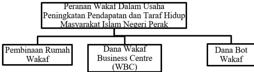
Rajah 3: Peranan Wakaf dalam membantu pembangunan ekonomi masyarakat Islam negeri Perak