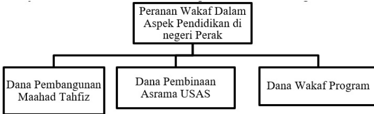
Rajah 1: Peranan Wakaf dalam Aspek Pendidikan di negeri Perak